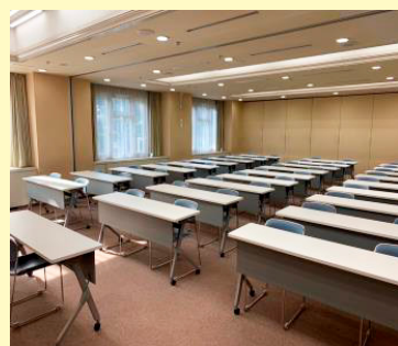
大会議室 教室形式 3×9列 54名