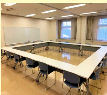
中研修室 口の字形式 3×2 20名